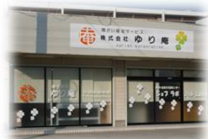
就労継続支援B型事業所「ジョブラボ」