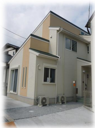
グループホーム市内に全5ヶ所

株式会社ゆり庵では、障がい者福祉サービスとして、市内に5ヶ所のグループホームと、就労移行支援事業所・就労継続支援B型事業所が各1ヶ所を運営しています。グループホームでは、家庭的なサービスをモットーとしながら入居者の方々の「安心な生活」を目指した支援を行っています。また、就労移行支援では、個々の就職という夢の実現をめざし「就職活動」その後の「定着支援」に力を入れ、就労継続支援B型では「働く喜び」を大切に、仲間と支えあいながら楽しく働ける場所の提供を目指しています。株式会社ゆり庵では、地域の一員として「生活・就業」また「子どもから大人まで」というようにトータルサポートが行える仕組みを実現します。