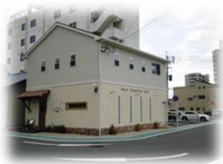
就労移行支援事業所「ジョブラボ」